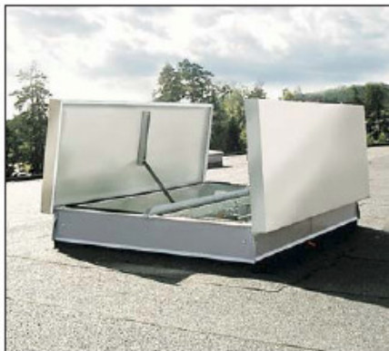
ORI 52 HT-S, Tabloidtryck AB, Södertälje