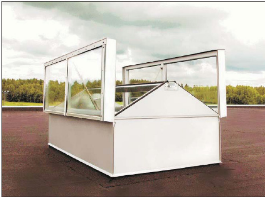
ORI 51/HT-GLAS Brandventilator, Lidl Logistics Center, Janakkala, Finland

Vanligtvis sker inkoppling av utrustningen via el-entreprenör. Inflexor AB hjälper även sina partners vad gäller installationer, testöppningar och service.