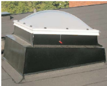
ORI 01/M, Opal akryl, Sollentuna